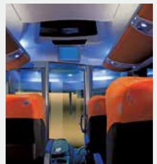
Nuevo ambiente interno más amplio, proporcionando mayor bienestar

¡Nosotros tenemos la solución adecuada para sus requerimientos!