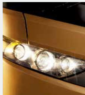
Conjunto óptico innovador en LED's