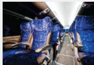
Nuevo ambiente más moderno, cómodo y sofisticado